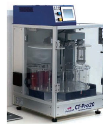
自社開発の自動パラフィン包埋装置 CT-Pro20