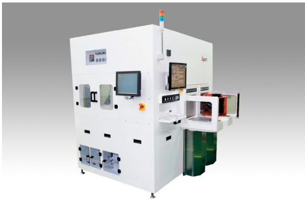
イアス社の主力製品である Expert (気相分析法(VPD)という検査を全自動でおこなう装置)

「当社がローツェグループの一員になれることを非常に嬉しく思います。ローツェ社の企業理念および社風に共感するところが多く、当社で今までに培ってきた 極微量金属分析のノウハウと、ローツェ社の自動化技術を融合することでより付加価値の高いオンリーワン製品の開発が加速できると考えております。また、 ローツェ社の傘下に入ることによって高品質で安定したサポート体制を構築し、国内外のお客様により迅速な対応が提供できると考えております。」