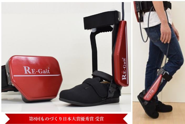
第8回ものづくり日本大賞優秀賞 受賞

歩行支援ロボット RE-Gait® (リゲイト) 効率的かつ効果的なりハビリテーションを実現